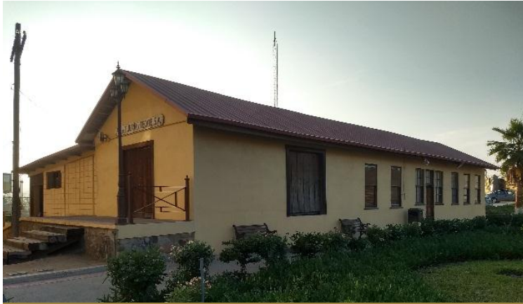
Antigua Estación Tijuana