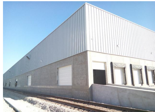
Patio y bodega García