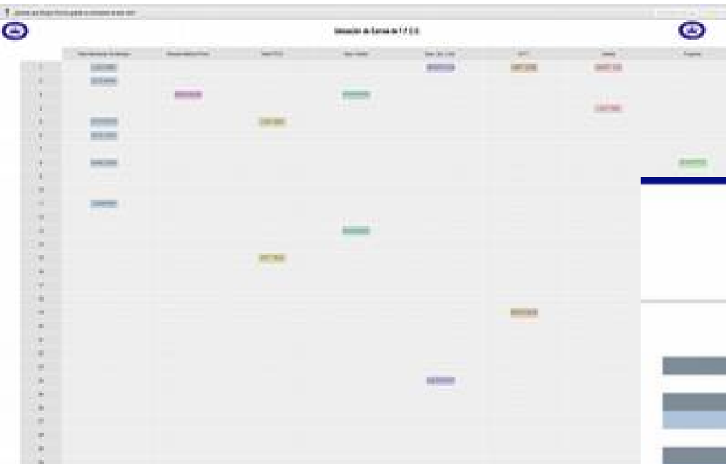
Pantalla en Tableta de campo.